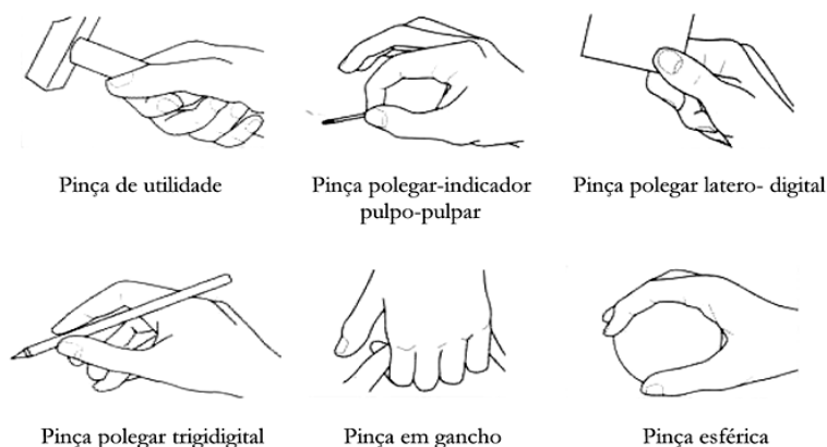
Fig. 1 — Principais pinças

Quando existir um intervalo para os coeficientes propostos, deve ser considerado, entre outros aspectos, o lado dominante e o prejuízo funcional e para as AVD.